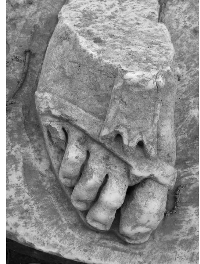
Rund um Neapel atmet jeder Stein Geschichte ... Überbleibsel einer antiken Marmorstatue am Wegesrand in Pozzuoli