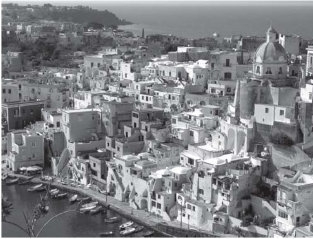
Blick vom Burgberg Procidas auf Marina di Coricella