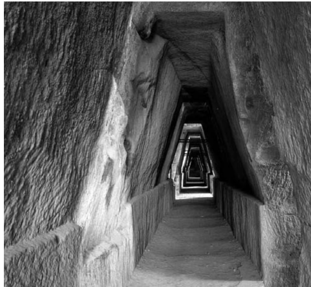
Cumä: Orakelhöhle der Sybille mit ihrem trapezförmigen Querschnitt

GEOPULS wurde im Jahr 2004 von Tübinger Geographie-Dozenten gegründet, mit dem Ziel, länderkundliche Exkursionen interessierten, reisefreudigen Menschen außerhalb der Universität anzubieten und beliebte Reiseziele einmal anders zu erleben. Dabei geht es keineswegs akademisch zu, sondern mit Geographen unterwegs zu sein bedeutet Menschen, Kultur, Kunst und Geschichte fremder Länder und Regionen mit Blick hinter die Kulissen kennen zu lernen. Die Landesnatur nimmt dabei breiten Raum ein. Bei allen Zielen stehen deshalb auch immer Themen zu Geologie, Klima, Vegetation und Landschaft auf dem Programm. Ausflüge und kleine Wanderungen in die Natur führen im Wechsel mit dem Kulturprogramm erst zu einem ganzheitlichen Erleben und Genießen. Dabei reisen Sie von Anfang an in einer kleinen, gemütlichen Gruppe Gleichgesinnter, persönlich geführt von einem landeskundigen Geographen. Das alles zum fairen Komplettpreis und ohne fakultative Zwänge. Geopuls arbeitet dabei von Anfang an eng mit verschiedenen Volkshochschulen in der Region zusammen.