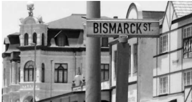
Bismarck Straße und Hohenzollern-Haus in Swakopmund

GEOPULS wurde von Geographie-Dozenten der Universität Tübingen gegründet. Die Idee ist, ein von Fachleuten und Landeskennern persönlich geführtes Exkursionsprogramm, interessierten und reisefreudigen Menschen außerhalb der Universität anzubieten. Mit Geographen auf Reisen zu sein bedeutet, Menschen, Kultur, Kunst und Geschichte fremder Länder und Regionen intensiv kennen zu lernen. Das Besondere dabei ist, dass damit das Programm einer Reise noch lange nicht erschöpft ist. Die Landes-Natur ist bei Geopuls nicht nur schöne Kulisse für die besuchten kulturellen Glanzlichter, sondern nimmt selbst breiten Raum ein. Bei allen Zielen stehen immer auch Themen zu Geologie, Klima, Vegetations- und Landschaftskunde auf dem Programm. Naturkundliche Ausflüge und kleine Wanderungen fehlen deshalb nie und führen im Einklang mit dem Kulturprogramm erst zu einem ganzheitlichen Erleben, Verstehen und Genießen. Dazu gehören, wo immer möglich, auch Genüsse der regionalen Küche und authentische Begegnungen. Ein weiteres Plus: Sie reisen von Anfang an in einer kleinen, persönlich geführten Gruppe Gleichgesinnter, zum fairen Komplettpreis und ohne fakultative Zwänge.