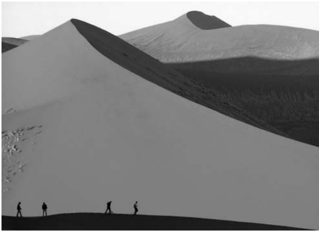
Sossusvlei mit den höchsten Dünen der Welt