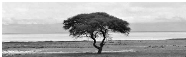
Die Schirmakazie, ein typischer Baum der namibischen Savanne

GEOPULS wurde von Geographie-Dozenten der Universität Tübingen gegründet. Die Idee ist, ein von Fachleuten und Landeskennern persönlich geführtes Exkursionsprogramm, interessierten und reisefreudigen Menschen außerhalb der Universität anzubieten. Mit Geographen auf Reisen zu sein bedeutet, Menschen, Kultur, Kunst und Geschichte fremder Länder und Regionen intensiv kennen zu lernen. Das Besondere dabei ist, dass damit das Programm einer Reise noch lange nicht erschöpft ist. Die Landes-Natur ist bei Geopuls nicht nur schöne Kulisse für die besuchten kulturellen Glanzlichter, sondern nimmt selbst breiten Raum ein. Bei allen Zielen stehen immer auch Themen zu Geologie, Klima, Vegetations- und Landschaftskunde auf dem Programm. Naturkundliche Ausflüge und kleine Wanderungen fehlen deshalb nie und führen im Einklang mit dem Kulturprogramm erst zu einem ganzheitlichen Erleben, Verstehen und Genießen. Dazu gehören, wo immer möglich, auch Genüsse der regionalen Küche und authentische Begegnungen. Ein weiteres Plus: Sie reisen von Anfang an in einer kleinen, persönlich geführten Gruppe Gleichgesinnter, zum fairen Komplettpreis und ohne fakultative Zwänge.