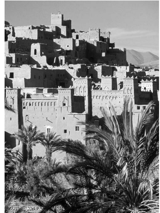
Berbersiedlung Ait Ben Haddou (UNESCO-Weltkulturerbe), Südmarokko