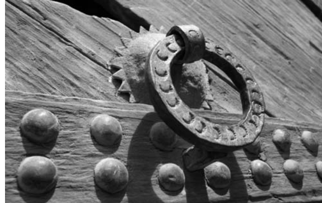
Türbeschlag in der Berbersiedlung Ait Ben Haddou (UNESCO-Weltkulturerbe)

Trotz unübersehbarer französischer Einflüsse ist das besondere Flair des orientalisches-islamischen Kulturkreises in den meisten Lebensbereichen immer noch lebendig: in Architektur, Kleidung, Lebens- und Wirtschaftsformen. Allein schon deswegen gilt Marokko als eine der eindrucksvollsten Reise-regionen des arabischen Raumes. Und trotzdem ist es ein Land, in dem Massentourismus nur an ganz wenigen Plätzen eine Rolle spielt.