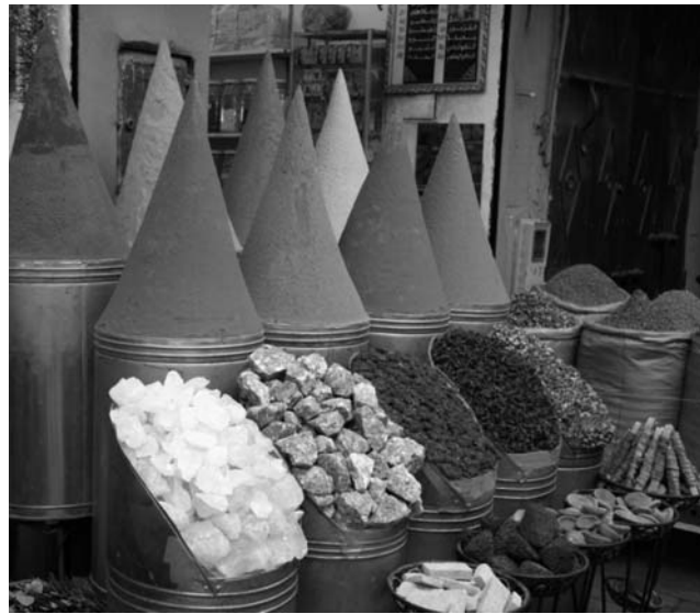
Überall im Land findet man in den traditionellen Souks (Bazare) kunstvoll arrangierte Auslagen, wie hier in der Altstadt von Marrakech

GEOPULS wurde im Jahr 2004 von Tübinger Geographie-Dozenten gegründet, mit dem Ziel, länderkundliche Exkursionen interessierten, reiseleidigen Menschen außerhalb der Universität anzubieten und beliebte Reiseziele einmal anders zu erleben. Dabei geht es keineswegs akademisch zu, sondern mit Geographen unterwegs zu sein bedeutet Menschen, Kultur, Kunst und Geschichte fremder Länder und Regionen mit Blick hinter die Kulissen kennen zu lernen. Die Landesnatur nimmt dabei breiten Raum ein. Bei allen Zielen stehen deshalb auch immer Themen zu Geologie, Klima, Vegetation und Landschaft auf dem Programm. Ausflüge und kleine Wanderungen in die Natur führen im Wechsel mit dem Kulturprogramm erst zu einem ganzheitlichen Erleben und Genießen. Dabei reisen Sie von Anfang an in einer kleinen, gemütlichen Gruppe Gleichgesinnter, persönlich geführt von einem landeskundigen Geographen. Das alles zum fairen Komplettpreis und ohne fakultative Zwänge. Geopuls arbeitet dabei von Anfang an eng mit verschiedenen Volkshochschulen in der Region zusammen.