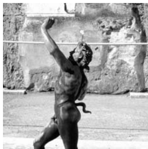
Pompeii: tanzender Faun