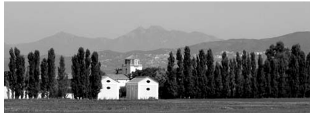
Unterkunft nahe des Cilento: Agriturismo und Bio-Landgut La Morella