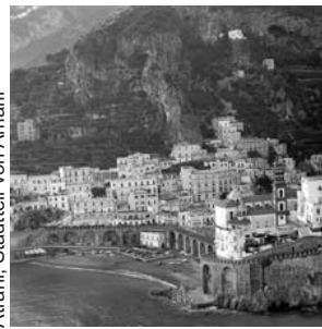
Atrani: Stadtteil von Amalfi