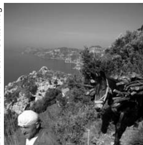
Beim Wandern auf dem Götterweg

GEOPULS wurde im Jahr 2004 von Tübinger Geographie-Dozenten gegründet, mit dem Ziel, länderkundliche Exkursionen interessierten, reisefreudigen Menschen außerhalb der Universität anzubieten und beliebte Reiseziele einmal anders zu erleben. Dabei geht es keineswegs akademisch zu, sondern mit Geographen unterwegs zu sein bedeutet Menschen, Kultur, Kunst und Geschichte fremder Länder und Regionen mit Blick hinter die Kulissen kennen zu lernen. Die Landesnatur nimmt dabei breiten Raum ein. Bei allen Zielen stehen deshalb auch immer Themen zu Geologie, Klima, Vegetation und Landschaft auf dem Programm. Ausflüge und kleine Wanderungen in die Natur führen im Wechsel mit dem Kulturprogramm erst zu einem ganzheitlichen Erleben und Genießen. Dabei reisen Sie von Anfang an in einer kleinen, gemütlichen Gruppe Gleichgesinnter, persönlich geführt von einem landeskundigen Geographen. Das alles zum fairen Komplettpreis und ohne fakultative Zwänge. Geopuls arbeitet dabei von Anfang an eng mit verschiedenen Volkshochschulen in der Region zusammen.