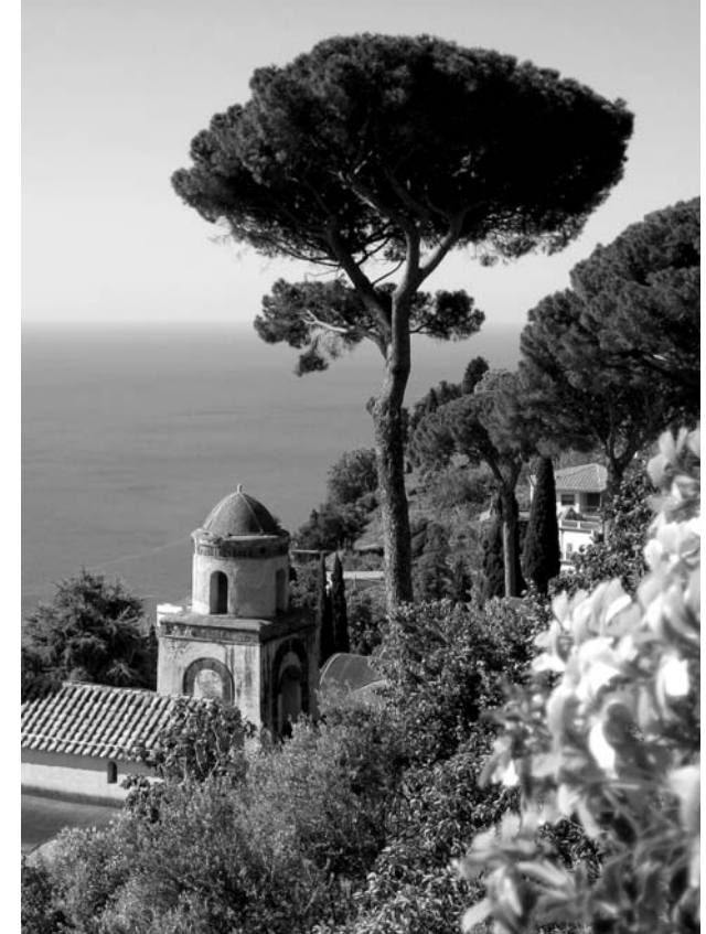
Ravello, Blick von der Villa Rufolo über die Kirche SS. Annunziata