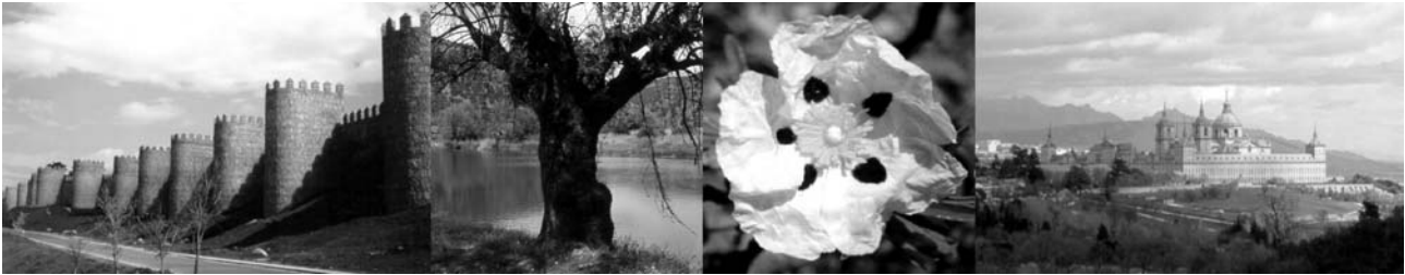
Bilder von links nach rechts: Stadtmauer von Avila, Flußidylle am Guadiana, Blüte der Lackzistrose in den Montes de Toledo, Klosterpalast in El Escorial