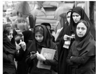
von links nach rechts: Yazd, Brücke über den Zayandeh in Isfahan, iranische Frauen