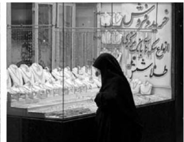
von links nach rechts: Azadi-Monument, Teheran mit Alburz-Gebirge, Goldladen im Bazar