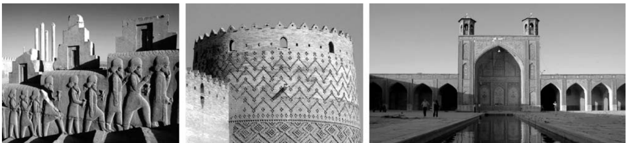
von links nach rechts: Relief in Persepolis, Arg-e Karim Khan (Stadtfestung von Shiraz), Vakil Moschee (Shiraz)

Unterkunft: ***Hotel in Shiraz (Parseh – 4 Übernachtungen)