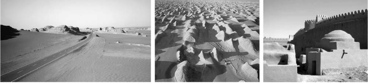
von links nach rechts: Straße durch die Wüste Lut, Yardangs, Lehmfestung Rayen

Unterkunft: ***Hotel in Kerman (Akhavan Hotel – 2 Übernachtungen)