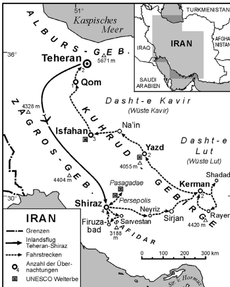
Reiseziele und -route im Überblick