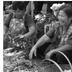
Marktszene in Khon Kaen

Mitglieder der Gesellschaft für Erdkunde zu Köln erhalten eine Ermäßigung von 60,- € auf den Exkursionspreis, und wer den Thailandaufenthalt im Anschluß an die Exkursion verlängern möchte, werden verschiedene Möglichkeiten angeboten.