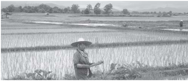
Reisfelder in Nordthailand