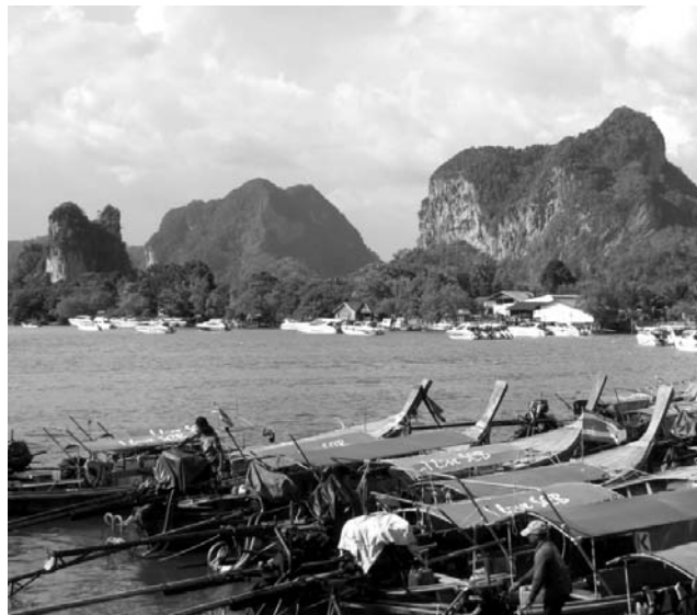
Landschaftselemente in Süd-Thailand: Karst, Mangroven und Meer